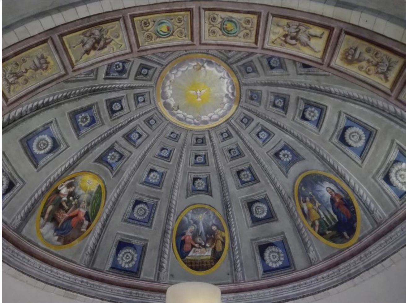
Les peintures du XIXème siècle de l'abside de l'église