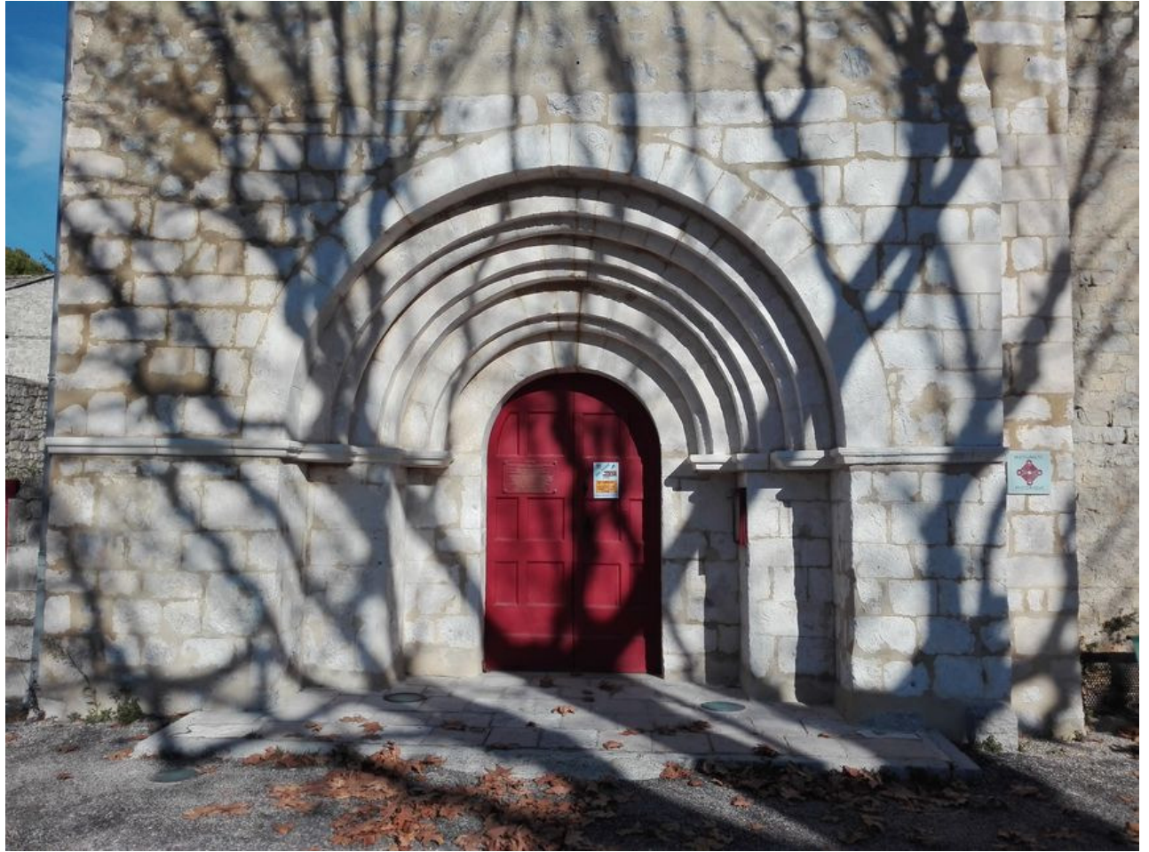
Le porche roman de l'église de Saint-Maurice-d'Ibie - Pierre-Jean Pluvy