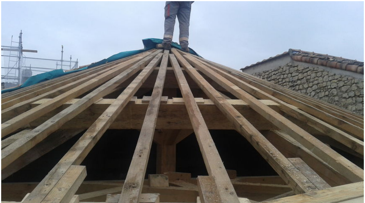
La nouvelle charpente de l'abside de l'église de Saint-Maurice-d'Ibie - Mairie de Saint-Maurice-d'Ibie

La maire de Saint-Maurice-d'Ibie (Ardèche) a reçu mercredi soir à Valence le prix des Rubans du Patrimoine remis par la Fédération Drôme-Ardèche du bâtiments et travaux publics. Un prix qui récompense le dynamisme de la commune pour la rénovation de son église romane.