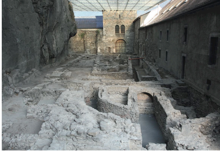
✚ Site abbatial du Martolet

En 2015, l'abbaye de Saint-Maurice d'Agaune fête le 1500 e anniversaire de sa fondation, ce qui en fait l'établissement religieux le plus ancien d'Occident toujours en activité. Parmi les nombreuses manifestations organisées pour commémorer cet événement figure la parution d'un ouvrage en deux volumes, le premier consacré à l'histoire, l'archéologie et l'architecture de l'abbaye, le second à son célèbre trésor d'art sacré. Une iconographie originale et de qualité y accompagne les résultats les plus récents de la recherche consacrée à cette institution à l'exceptionnelle longévité.