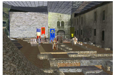
Tableau final : Site archéologique du Martolet (vestiges des anciennes églises): tous les personnages des tableaux et ceux rencontrés en chemin entrent dans le Martolet pour un tableau final où lumières, voix et chant gospel créent une ambiance magique...

24 représentations du 11 août 2015 au 6 septembre 2015